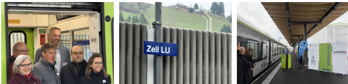
Bilder: Eröffnungsanlass am 11. Dezember 2025 zur Verlängerung der S77 nach Zell

Zunächst bedanken wir uns herzlich für eine Stärkung der Bahnerschliessung in der REGION LUZERN WEST: Wir freuen uns sehr, dass die S77 mit dem letzten Fahrplanwechsel im Dezember 2025 mit zwei Kurspaaren zu Hauptverkehrszeiten am Vormittag bis nach Zell verlängert wurde. Wir erachten dies als wichtigen Zwischenschritt hin zu einer beschleunigten Verbindung Luzern-Wolhusen-Willisau-Huttwil-Langenthal.