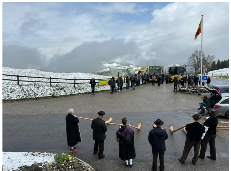
Eröffnungsanlass am 25. April 2023

Antrag: Der VVL finanziert die Linie 252 im Gebiet des Kantons Luzern ab dem Jahr 2026.