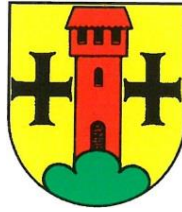
Escholzmatt - Marbach