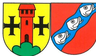
Escholzmatt - Marbach